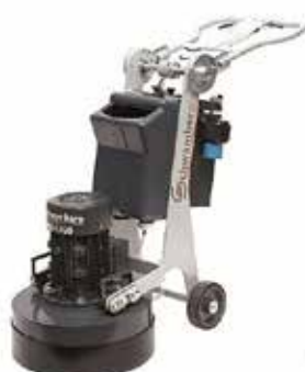
Slipemaskin DSM 430 Slipebredde 430mm Art.nr: 40-024