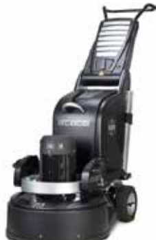
Slipemaskin HTC 650 Slipebredde 650mm Art.nr: 40-028