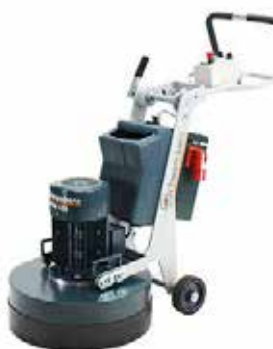
Slipemaskin DSM 530 Slipebredde 530mm Art.nr: 40-026