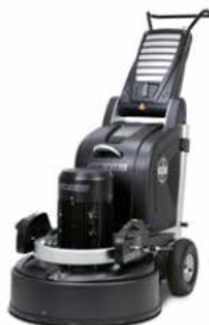
Slipemaskin HTC 800 med radio kontroll Slipe bredde 800mm Art.nr: 40-030