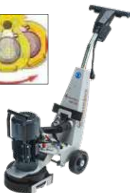
Slipemaskin DSM 250 Slipebredde 250mm Art.nr: 40-020