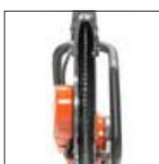
Maksimal optimert effekt