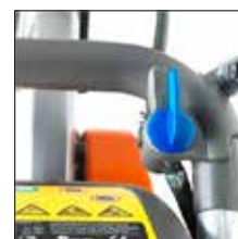
Mindre støv og lavt vannforbruk