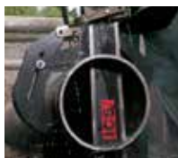
Kan sage metallrør