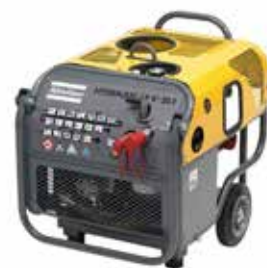
Aggregat fra Atlas Copco Art.nr: 20-002