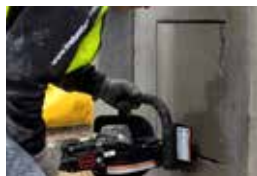
Kan sage vinkler