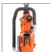
Eksepsjonelt lave vibrasjoner