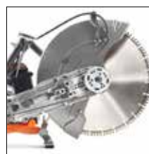
Enkel og optimal remspenning