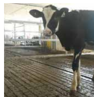
Anti skli mønster for fjøs.