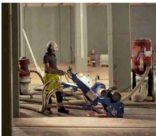
Med hjelp av laser så blir gulvet 100%.

mønster. De fleste betongspor er kuttet omtrent 2,5 til 5 cm fra hverandre og kan skjære gjennom betonggulvet så grunt eller dypt som nødvendig. Deretter kan f.eks en fresemaskin fjerne toppingen mye mer effektivt.