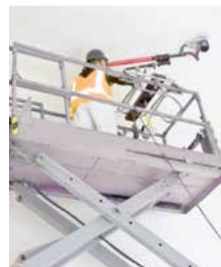
Og i taket bruker vi spesialrigg på lift.