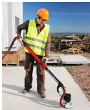
Gulvsliping med denne.