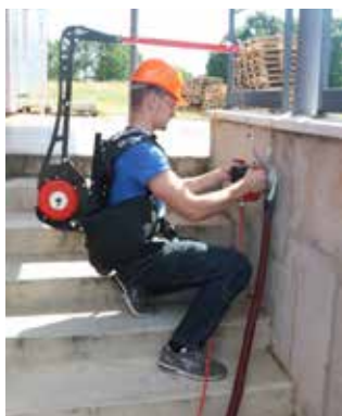
Mindre jobber gjør vi med denne.