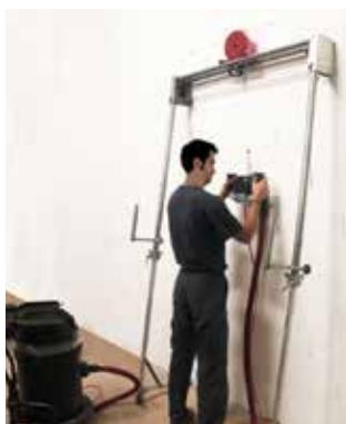
Større jobber med denne.