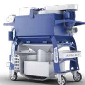
Støvsuger med stor sugekapasitet.