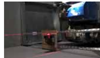
Laser for oppretting