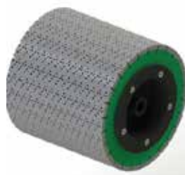
Shaving m/diamant fres