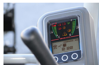
Praktisk display for alle funksjoner