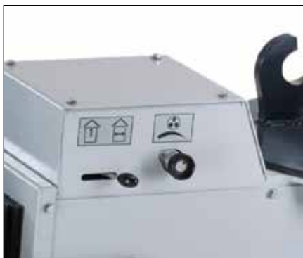
Vegg- og takomkobling og kontinuerlig hastighetsjustering

WDS 530 har en rekke egenskaper som vil endre hvordan vi jobber og tenker rundt arbeid med vegger og tak. I tillegg til en rekke arbeidsbesparende praktiske operasjoner, så innbyr den også til nye, spennende og kreative designløsninger.