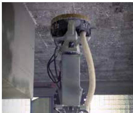
Arbeidshøyde opp til 6,5 m