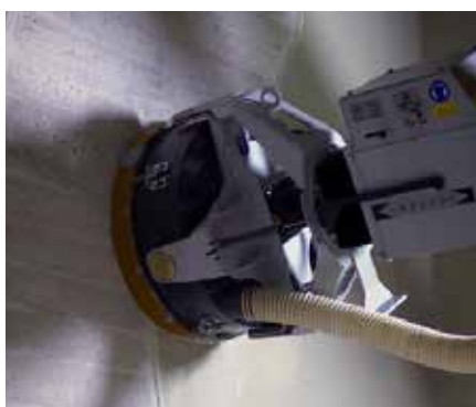
Skånsom sliping som ikke skader byggningskonstruksjonen