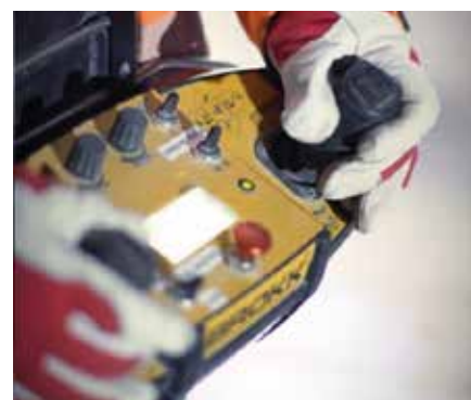
Fjernkontroll gjør arbeidet tryggere og enklere