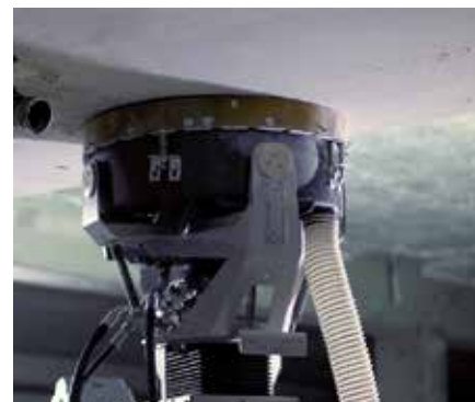
Konsekvent høyt og justerbart kontaktptrykk