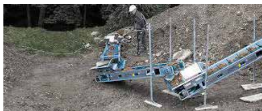
Inntil 3 transportbånd kan settes etter hverandre.