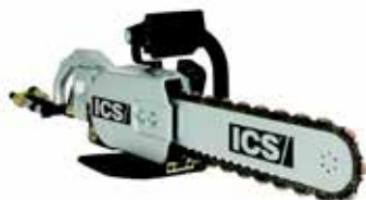
ICS Kjedesag hydraulisk Sagedybde 320mm