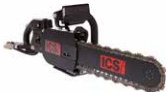
ICS Kjedesag hydraulisk (Inntil vegg) Sagedybde 320mm