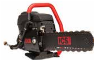
ICS Kjedesag bensindrevet Sagedybde 400mm