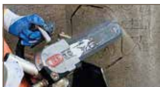
Kan sage 4 kanter