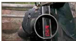
Kan sage metallrør