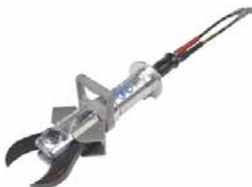
Papegøye nebb for stål