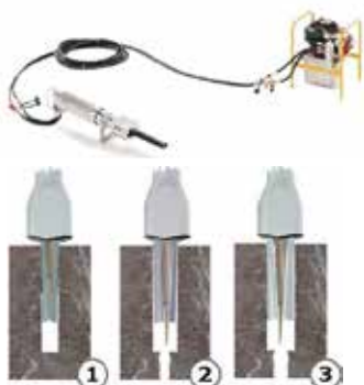
2. Senk "splitteren" i hullet enten horisontalt eller vertikalt.