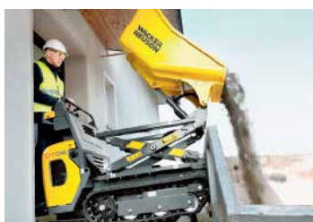
Forlenget saksehev (tilleggsutstyr)