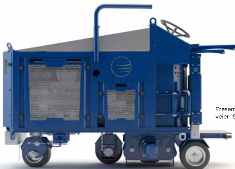
Fresemaskinen veier 1500 kg