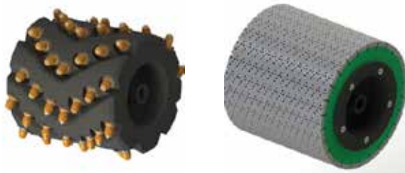
Shaving m/diamant fres