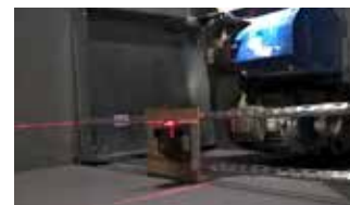
Laser for oppretting