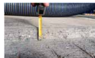
Freser bort inntil 60mm