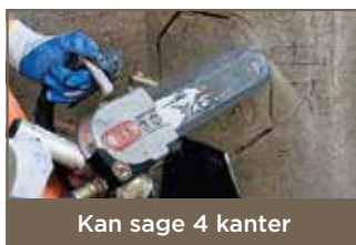
Kan sage 4 kanter