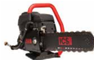
ICS Kjedesag bensindrevet Sagedybde 400mm