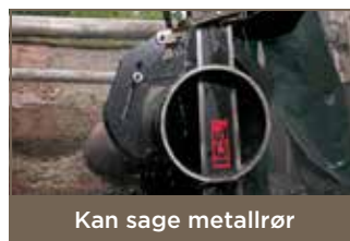
Kan sage metallrør