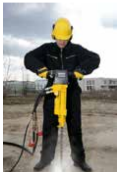
1. Bor et hull 41-48mm