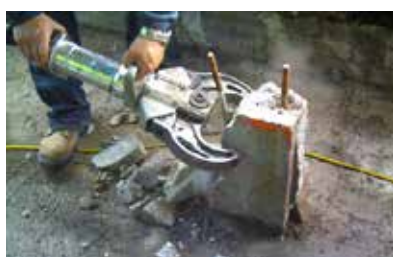
Betong saks (145mm)