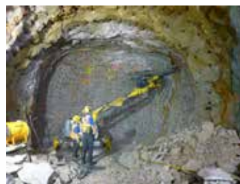
Brokk 180 utstyrt med boretårn.

Brokk 180 er en universalmaskin med enestående kapasitet og stabilitet. Den kan brukes til de fleste applikasjoner der de unike Brokk-funksjonene lav vekt, høy produktivitet og god tilgjengelighet er viktige faktorer.